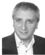
di Michelangelo Ingrassia