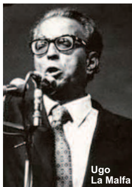
Ugo La Malfa